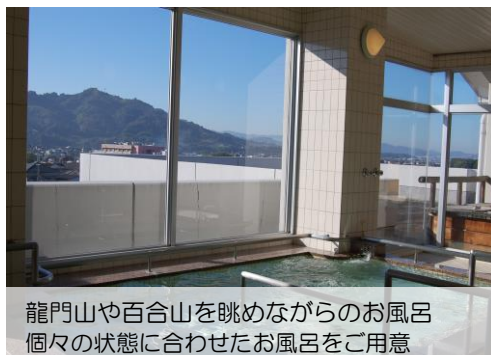
龍門山や百合山を眺めながらのお風呂 個々の状態に合わせたお風呂をご用意